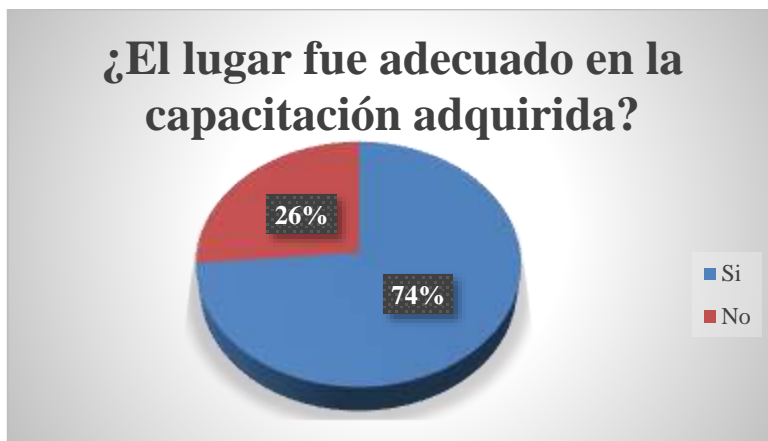
Ilustración N°5: Lugar en el que se capacito a los funcionarios del CSVP.

Mediante el siguiente gráfico se puede visualizar que al público que se le brindó la capacitación, en su mayoría indicaron que el lugar fue adecuado para recibir la misma, en comparación con una minoría del 26%, que indicó que el lugar no fue el adecuado para recibir estos conocimientos.