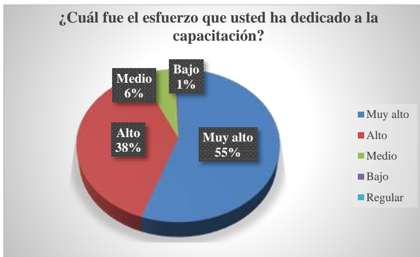
Ilustración N°3: Tiempo que dedicó cada funcionarios del CSVP en la capacitación