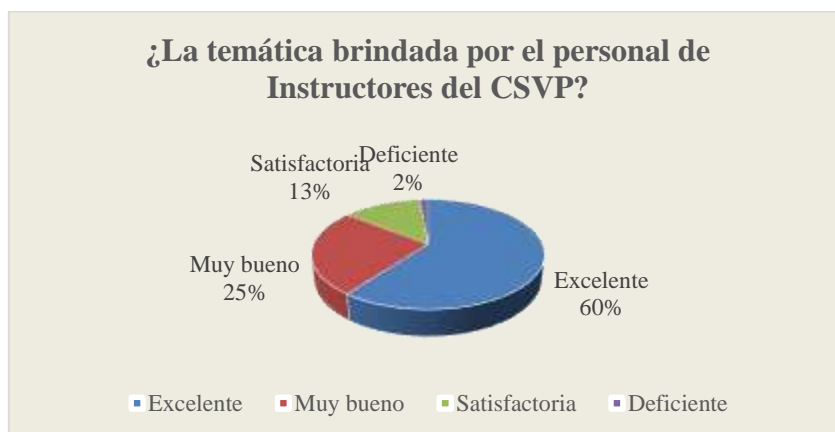
Ilustración N°2: Temas de que se capacito a los funcionarios del CSVP

En la primera pregunta realizada a los servidores del CSVP, la cual indica si la temática brindada por el personal de Instructores en los temas de la Ley Orgánica que regula el uso legítimo de la fuerza y Defensa Personal, se puede observar que se tuvo gran acogida al analizar el resultado arrojado con un 60% de respuestas excelente y con un 2% que indicaron que fue deficiente.